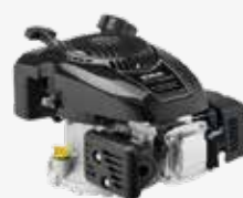
KOHLER 5L MZ1770