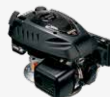
RATO 5R MZ1780