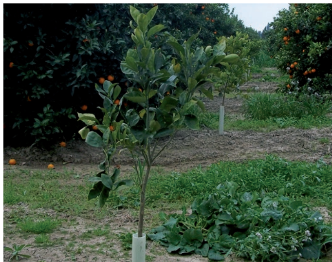
FruitWrap a Doppia parete